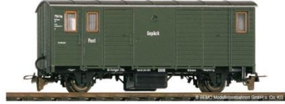
Gepäckwagen (Packwagen) Bauart 1894 Für die Bottwarbahn entwickelt Bemo-Artikel 3001 813 | Preis ca. 40,- €