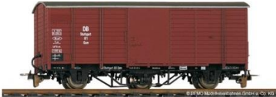
Gedeckter Güterwagen (Gw) Bauart 1894 Bei Großandrang auch als „Personenwagen“ eingesetzt! Bemo-Artikel 2004 812 | Preis ca. 38,- €