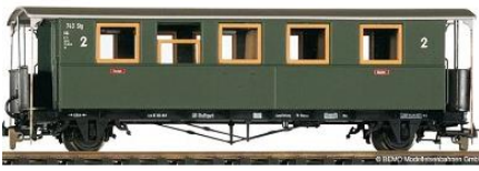
Personenwagen Bauart BCI von 1894 (Touristenwagen, für die Bottwarbahn entwickelt) Bemo-Artikel 3013 813 | Preis ca. 40,- €