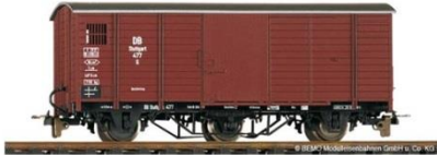
Gedeckter Güterwagen (Gw) Bauart 1910 Vorbild: Verstärkte Ausführung für 15 t statt 10 Traglast Bemo-Artikel 2002 817 | Preis ca. 39,- €