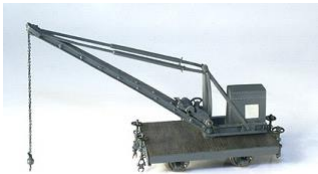
Kranwagen | Stationiert in den „Wein-Stationen“ der Bottwarbahn, wohl zum Verladen von Weinfässern. Modell: Kranwagen der Jagsttalbahn; die Bottwarbahn besaß jedoch fast die gleiche Ausführung. Modell: Hersteller Panier | Artikelnummer 1060/09; Preis ca. 84,- €. Metallbausatz, Fachwissen und Erfahrung empfohlen. Fertigmodell (Artikel 1060/29) ca. 260,- € www.carocar.com/html/m_1060.html