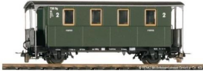
Personenwagen Bauart Di von 1910/1922 Einst vierte Klasse, der Arme-Leute-Wagen Bemo-Artikel 3003 820 | Preis ca. 40,- €