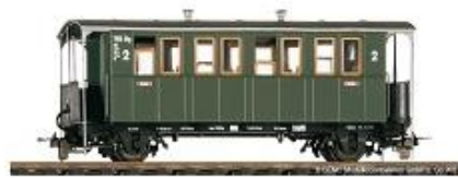
Personenwagen Bauart Ci von 1899 (Drittklässler) Bemo-Artikel 3002 821 | Preis ca. 40,- €