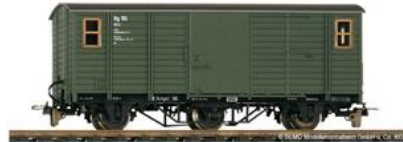
Hilfs-Packwagen von 1922 Bemo-Artikel 3005 815 | Preis ca. 40,- €